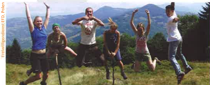
Freiwilligendienst EFD, Polen