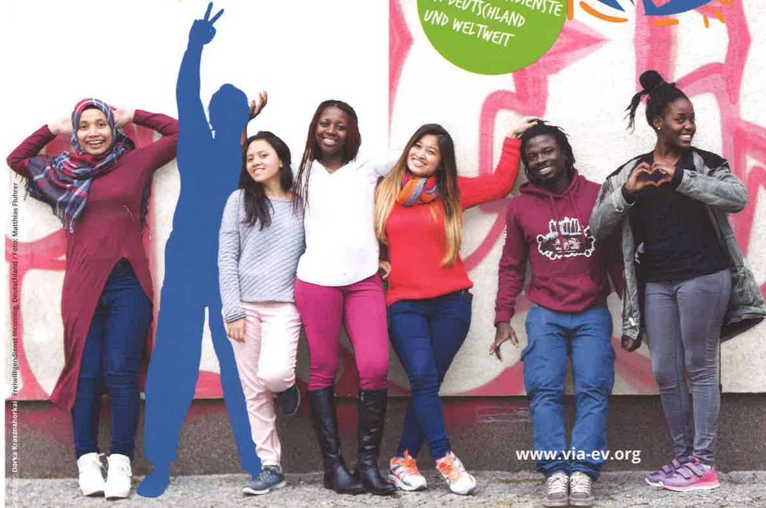
Foto: Dora Kraszmalhorkai | Freiwilligendienst Incoming, Deutschland / Foto: Matthias Flührer